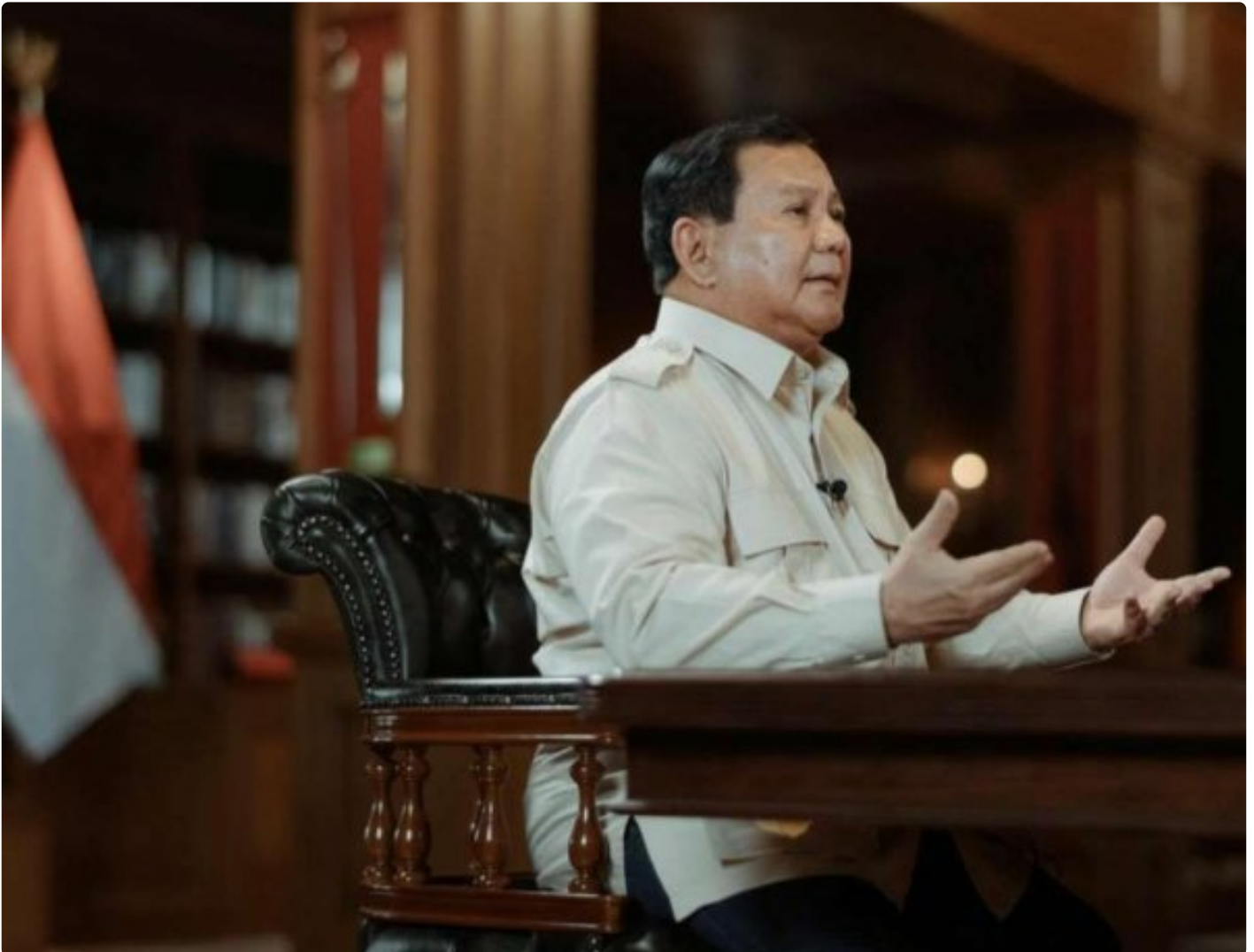
Prabowo Subianto Presiden RI 2024-2029

PENDIDIKAN - Indonesia dikenal sebagai negara yang kaya akan sumber daya alam. Dari hasil tambang yang berlimpah, laut yang luas dengan kekayaan hayati